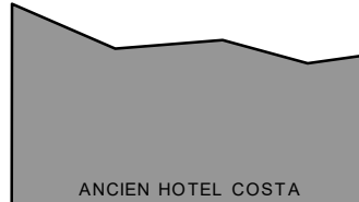
ANCIEN HOTEL COSTA